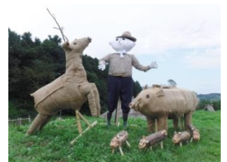
※今年度実施した案山子づくりの様子